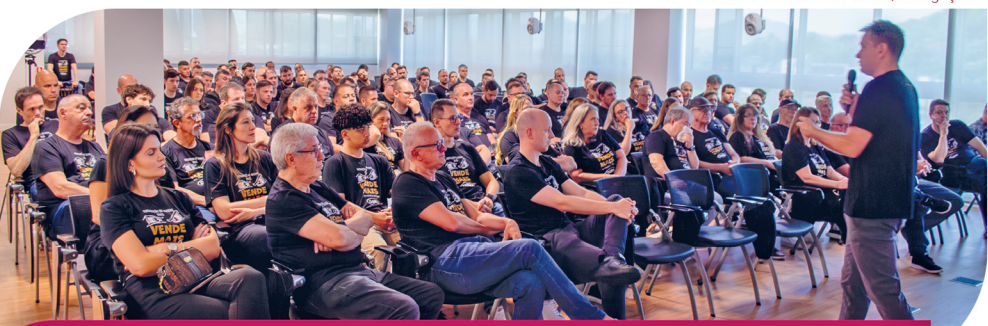
Programação reuniu, em Encantado, 150 representantes da Dália Alimentos que atuam no RS