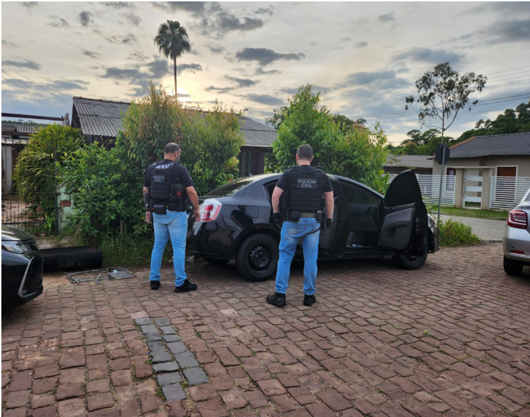
Suspeitos presos são moradores do município