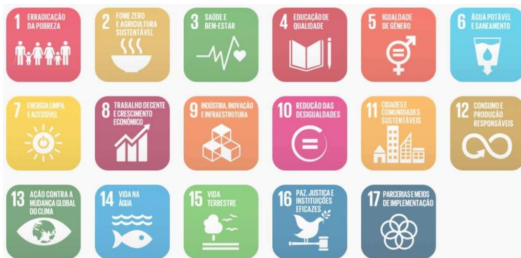
Figura 02: Objetivos de Desenvolvimento Sustentável